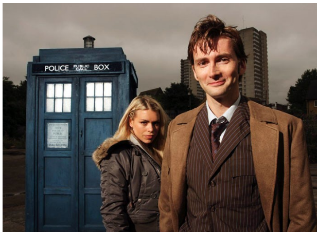
David Tennant som den tionde doktorn.

I serien är doktorn en Time Lord som reser runt i TARDIS, eller rättare sagt en TARDIS Typ 40 som är en föråldrad modell. En del humor kommer sig av att TARDIS på samma gång är otroligt avancerad men samtidigt gammal, fungerar dåligt och ibland