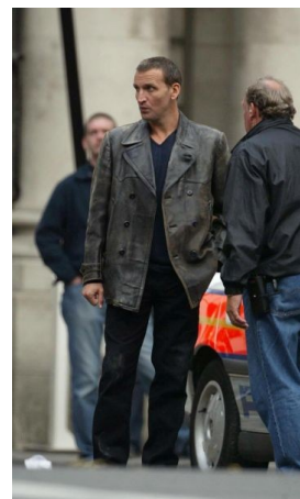
Christopher Eccleston som den nionde doktorn.

Den nionde doktorn spelades av Christopher Eccleston när serien började produceras igen 2005. Doktors personlighet är melankolisk och hans ensamhet visar sig. Visserligen kunde han kläcka några skämt vid fara men han visade sig allvarlig på egen hand. Han ogillade skjutvapen men använde våld om det var nödvändigt. Den nionde doktorn gillade inte människor och kallade dem "dumma apor". En viss skillnad från tidigare regenereringar som bl.a. kallat ansett människor som hans favoritart. Doktors språk ändrade sig också och ibland använde han slang och svordomar.